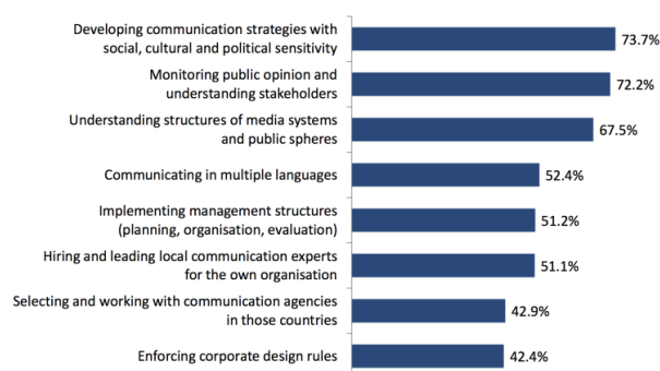
Major challenges of international communication in non-European countries