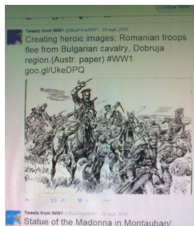
Fig. 1. Lupte între trupele românești și cavaleria bulgară în Dobrogea

Jurnalele, scrisorile, fotografiile, desenele sau poeziile personale sunt folosite pentru descrierea vieții de zi cu zi a oamenilor, indiferent de care parte a baricadei au luptat guvernele lor în timpul războiului.