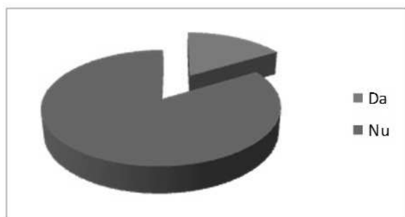
Figura 2 Comunicarea bibliotecii cu utilizatorii prin intermediul Facebook

A treia întrebare a fost dacă li s-au trimis vreodată anunțuri sau dacă biblioteca a comunicat vreodată cu ei prin intermediul Facebook. 46 de studenți au dat un răspuns negativ și doar 9 studenți au declarat că biblioteca s-a conectat cu ei prin intermediul Facebook și au spus că au primit anunțuri cu privire la diverse acțiuni desfășurate în bibliotecă sau organizate de bibliotecă, dar au precizat că nu a existat nici un alt tip de comunicare cu biblioteca. (Figura 2)